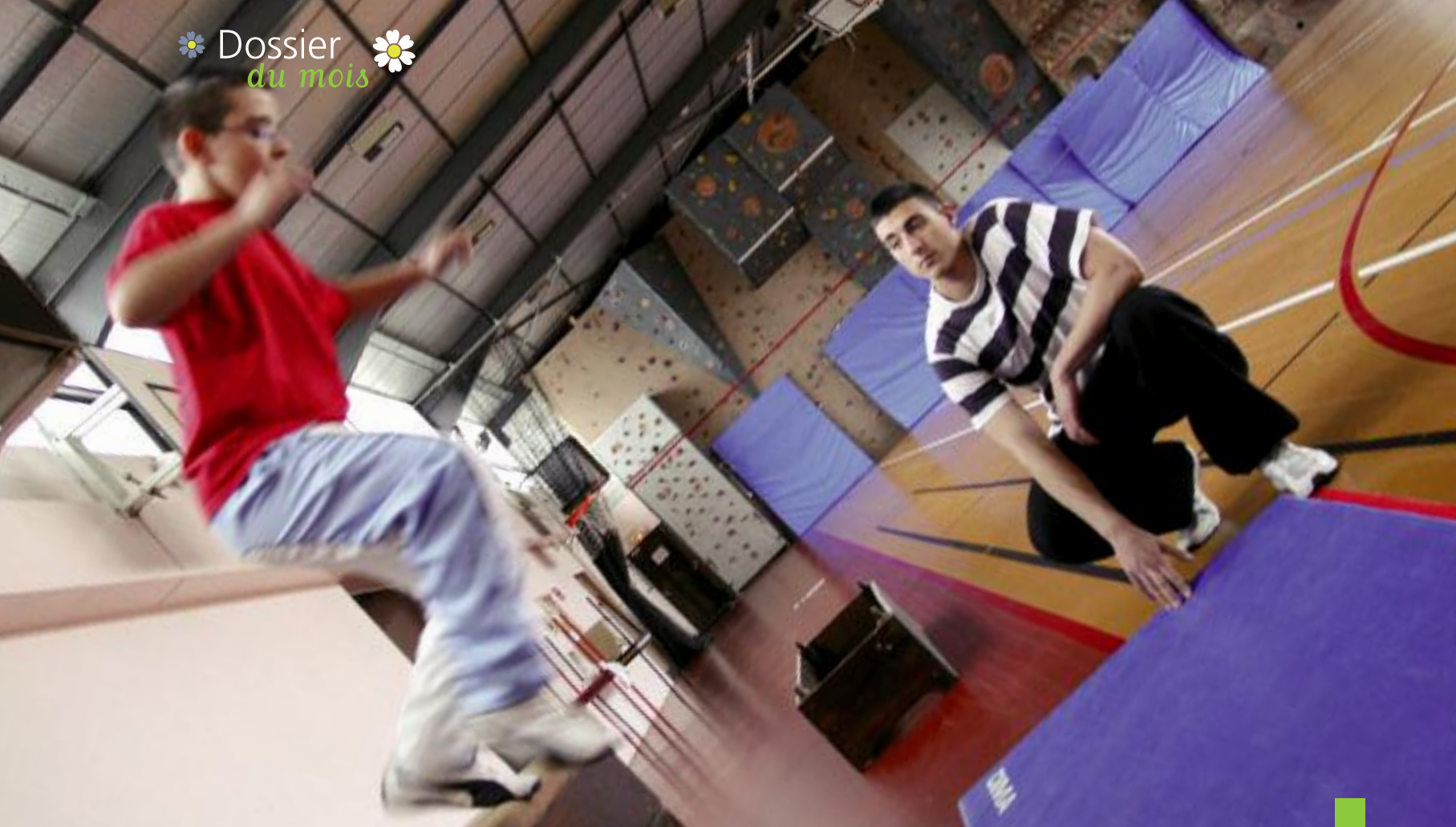
Initiation au parkour pendant les vacances de printemps. Cette discipline consiste à transformer les éléments urbains en obstacles à franchir par des sauts ou de l'escalade.