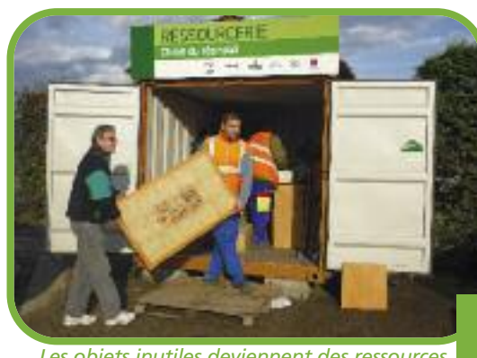
Les objets inutiles deviennent des ressources au chalet du réemploi.

Mise en place depuis octobre 2008, ce service enregistre une certaine montée en charge, attestant que la sensibilisation a porté ses fruits. La première année, 4,5 tonnes d'objets ont été collectées. Depuis octobre dernier, en six mois seulement, le chiffre s'élève déjà à 4 tonnes, le gros de