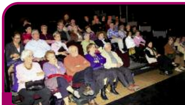
Rencontre avec l'association Domicile intergénération Isérois lors de la Semaine bleue.

Sexagénaires, septuagénaires, octogénaires... et plus, représentent près de 17 % de la population eybinoise. Au centre de ce numéro du Journal d'Eybens un document propose aux Eybinois de 60 ans et plus de prendre quelques minutes pour répondre à des questions sur leur façon de vivre à Eybens, leurs loisirs, leurs déplacements... Ce questionnaire a été élaboré suite à l'obtention par la Ville du label "Bien vieillir, vivre ensemble" remis par le ministère de la Santé en février dernier. Eybens est l'une des 34 villes en France labellisées pour la qualité des services mis en place en direction des personnes âgées et des retraités. Les critères d'attribution prenaient également en compte le logement, les transports, la vie sociale ainsi que la vie citoyenne. Eybens s'est engagé à travers ce label à établir un diagnostic de la situation des personnes âgées et des retraités sur la commune. Une étude dont la première étape est ce questionnaire. Les réponses fournies permettront de mieux connaître les besoins des Eybinois de 60 ans et plus, et ainsi d'adapter l'action de la