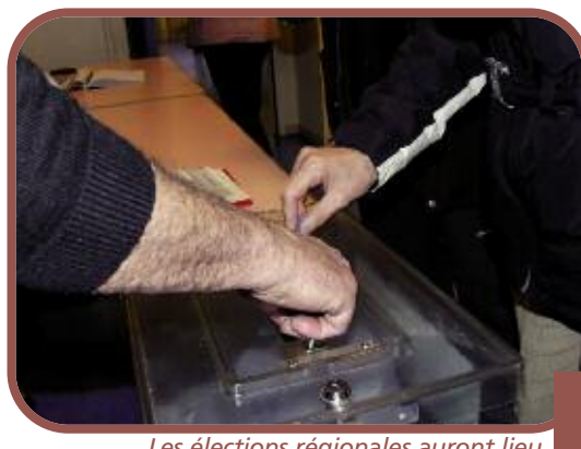
Les élections régionales auront lieu les 14 et 21 mars 2010.

Cette règle électorale risque toutefois de changer puisqu'un projet de réforme des collectivités territoriales vise à remplacer les conseillers généraux et régionaux par un conseiller territorial qui siègerait à la fois au Département et à la Région, dont l'existence n'est toutefois pas remise en cause. Ces conseillers territoriaux seraient élus à l'échelon cantonal par un scrutin uninominal à un tour, et 20 % des sièges seraient répartis à la proportionnelle. Ainsi, en 2014, trois mille conseillers territoriaux devraient être élus à la place des six mille conseillers généraux et régionaux. Si cette réforme voit le jour, les nouveaux conseillers régionaux qui seront élus en 2010 devraient voir leur mandat réduit de 2 ans.