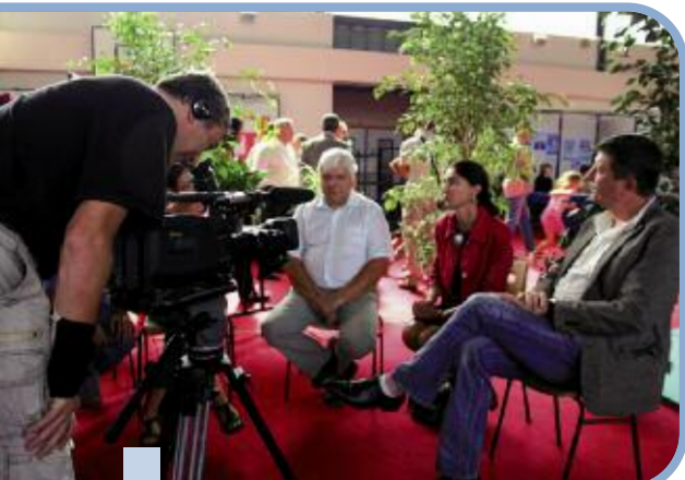
L'équipe d'Alpes Presse a filmé la vie citoyenne à Eybens de juin à octobre 2009.

Deux vidéos sont en ligne sur le site internet de la Ville pour mieux connaître le rôle et le fonctionnement des instances de participation citoyenne à Eybens.