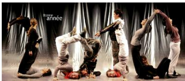
Le "2010" a été réalisé par les élèves du Conservatoire de musique et de danse d'Eybens et ceux de l'atelier hip-hop du Centre Loisirs et Culture.