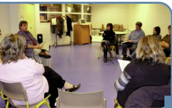
En novembre dernier, une première réunion à l'Iliade présentait le projet de réseau d'échanges réciproques de savoirs.

Apprendre l'anglais et recevoir des conseils en jardinage, s'initier à l'informatique contre des cours de cuisine, enseigner le français et découvrir la couture, le principe d'un Réseau d'échanges réciproques de savoirs est simple : il suffit de mettre en contact les personnes qui souhaitent découvrir un savoir avec celles qui souhaitent le transmettre. Avec le soutien du centre social, un réseau voit le jour sur Eybens. L'idée de mettre en place un réseau d'échanges sur la commune est née de quelques habitants des Maisons Neuves à la suite d'un atelier cuisine en lien avec la banque alimentaire. Au moment du bilan de