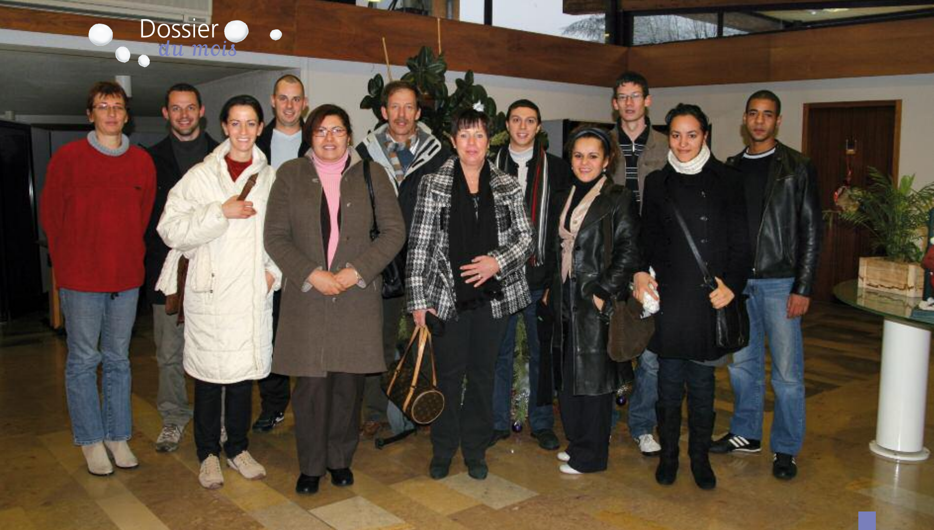
Quelques-uns des 19 agents recenseurs qui sillonneront la commune du 21 janvier au 20 février.