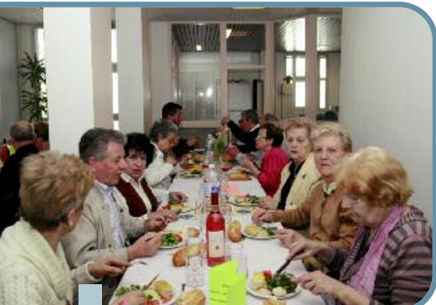
Le repas de printemps à la Maison des Coulmes sera suivi cette année d'une animation partagée avec des enfants.