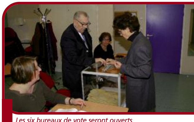
Les six bureaux de vote seront ouverts de 8 h à 19 h.

Eybens compte 6 170 électeurs (chiffre 2008). Les six bureaux de vote sont inchangés depuis les dernières élections : restaurant scolaire de l'école Bel Air, Maison des associations, restaurant scolaire de l'école du Val, Maison des Coulmes et deux bureaux à l'Illiad.