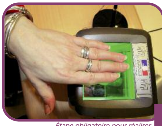
Étape obligatoire pour réaliser le passeport : la numérisation des empreintes digitales.

Pour déposer un dossier, il est impératif de prendre rendez-vous à l'accueil de la mairie (réserver une demi-heure). Le passeport est réalisé dans un délai raccourci (dix jours maximum) et doit être retiré entre 11 h 30 et 12 h 15 et entre 16 h 30 et 17 h (ou sur rendez-vous si impossibilité). Les personnes concernées, y compris les enfants, doivent être présentes lors du retrait, comme lors du dépôt du dossier.