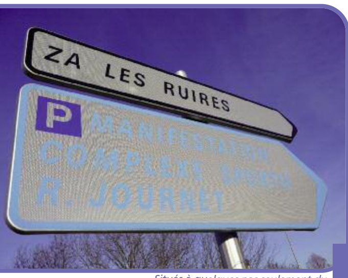
Situés à quelques pas seulement du complexe sportif Roger Journet, les parkings de la zone d'activités des Ruires sont la solution idéale les jours de rencontre sportive.

Soucieuse d'offrir un stationnement adapté à la fois aux habitants et aux visiteurs, la Ville aménage des places de parking gratuit sur tout son territoire. Pourtant, à Eybens comme ailleurs, quelques conducteurs irrespectueux n'hésitent pas à stationner n'importe où et n'importe comment au risque de mettre en danger la sécurité des personnes. La chaussée pour les véhicules motorisés, les pistes cyclables pour les cycles, les trottoirs pour les piétons : ces règles de "bonne conduite" très simples visent