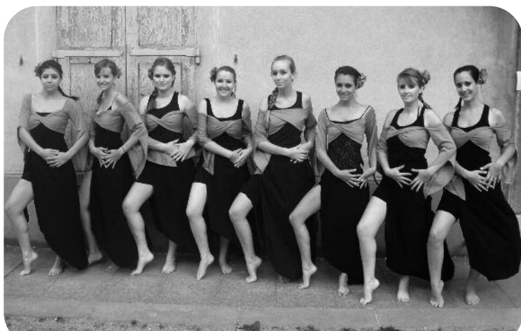
Groupes de danseuses lors des Z’eybinoiseries 2011