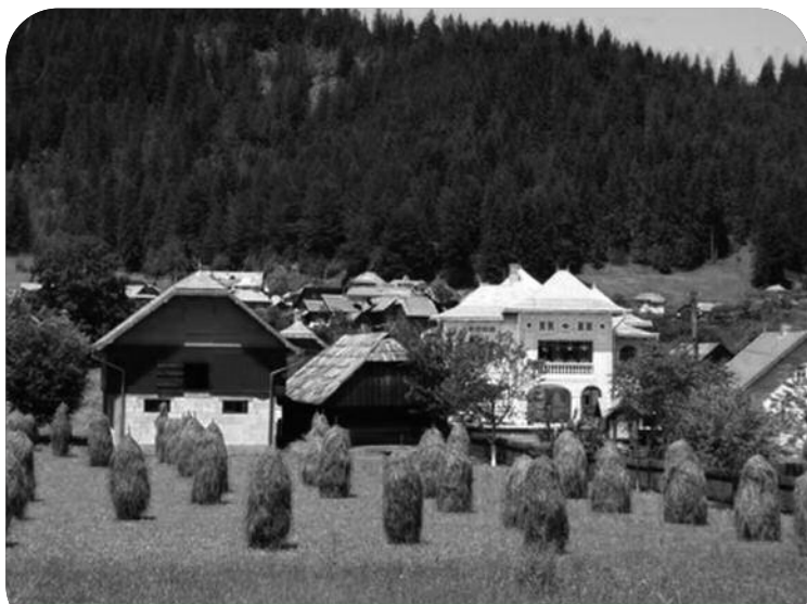
La fenaison au mois de juillet à Vama