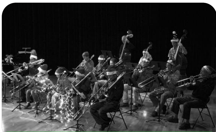
Concert de Noël du CRC