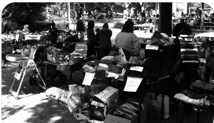
Vide grenier avec l'association AILE