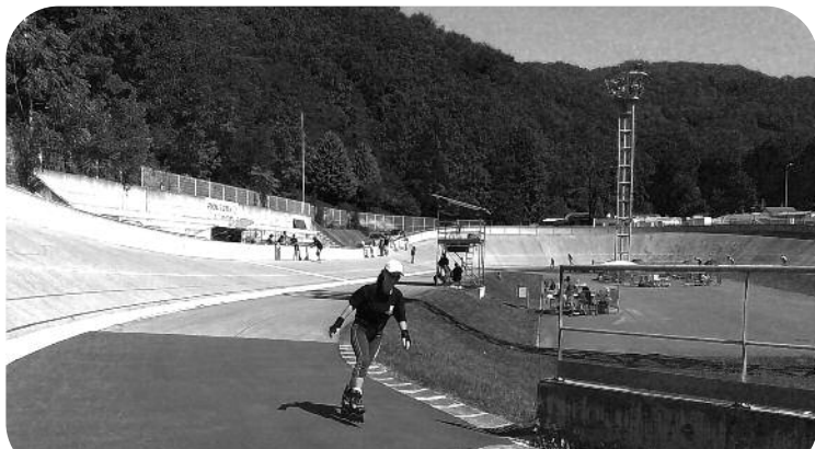
Roller au vélodrome avec Eybens Grenoble roller tour