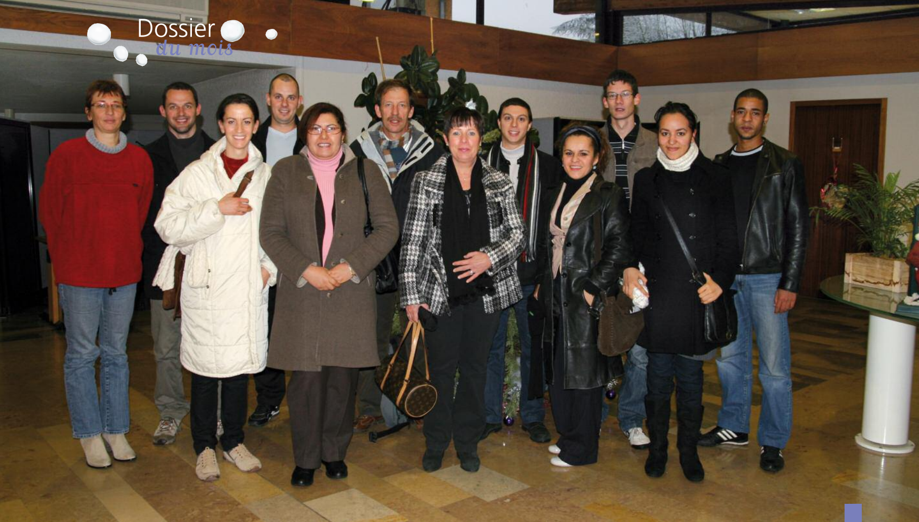
Quelques-uns des 19 agents recenseurs qui sillonneront la commune du 21 janvier au 20 février.